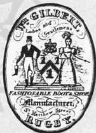
ギルバート創業時の商標