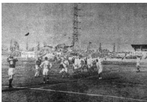
全国大学大会 準決勝 北海道大学 vs 西南学院大学 1962年(昭和37年)1月4日

全国大学大会東北予選 決勝 東北学院大学 vs 岩手大学 1964年(昭和39年)11月18日