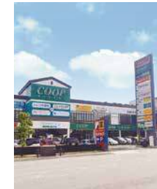
【商業施設】 レキシトンプラザ八幡

本社 仙台市青葉区国分町1丁目8-11 ☎022-222-8940(代) ご注文は ☎022-0120-008-940 お問い合わせは ☎022-0120-172-823 https://monaka.jp/ 全国発送を承っております。どうぞお気軽にご利用くださいませ。