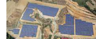
栗駒猿飛来太陽光発電所