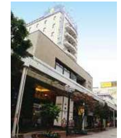
【商業ビル】 一番町センタービル